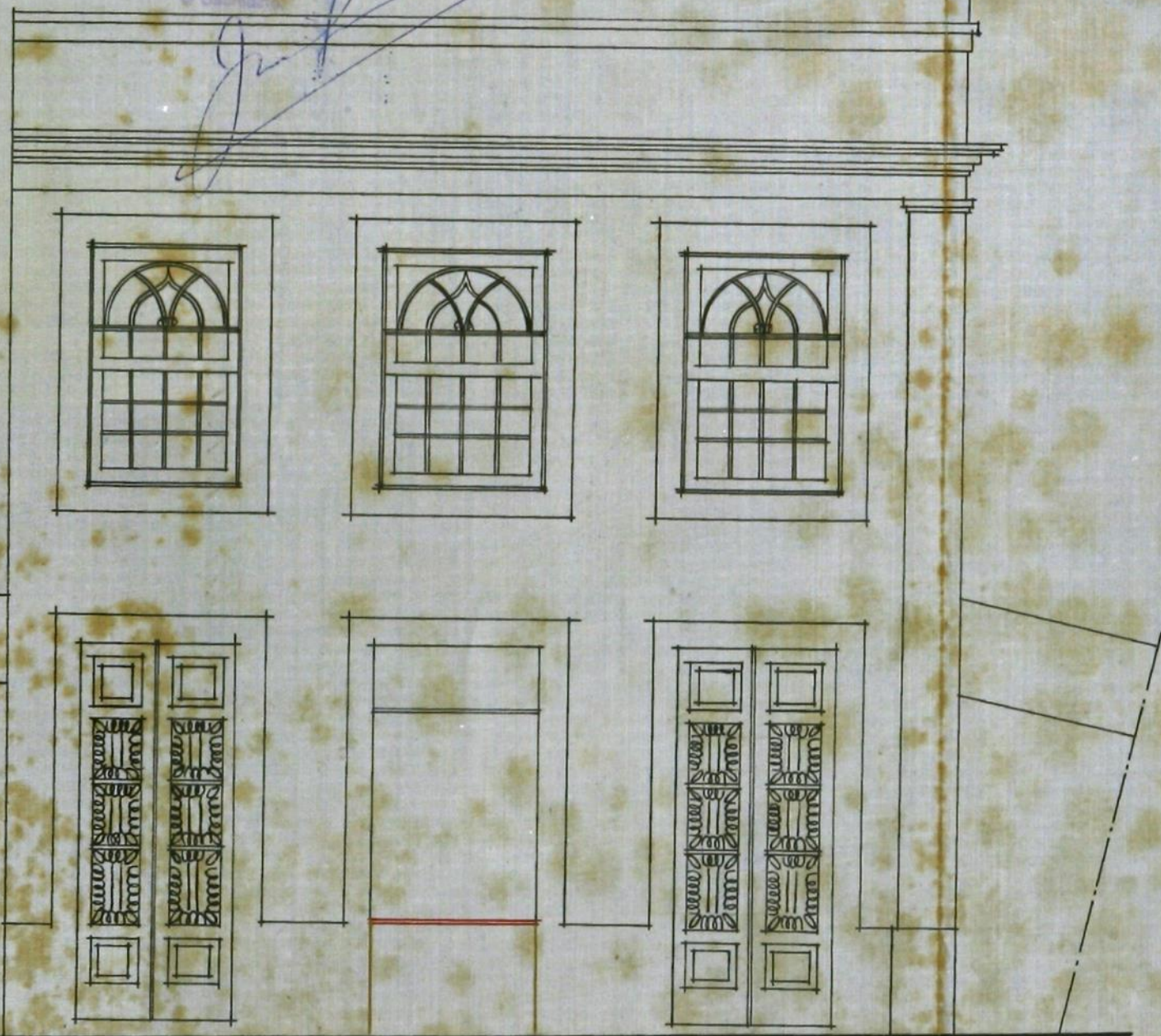
• ALÇADO PRINCIPAL •