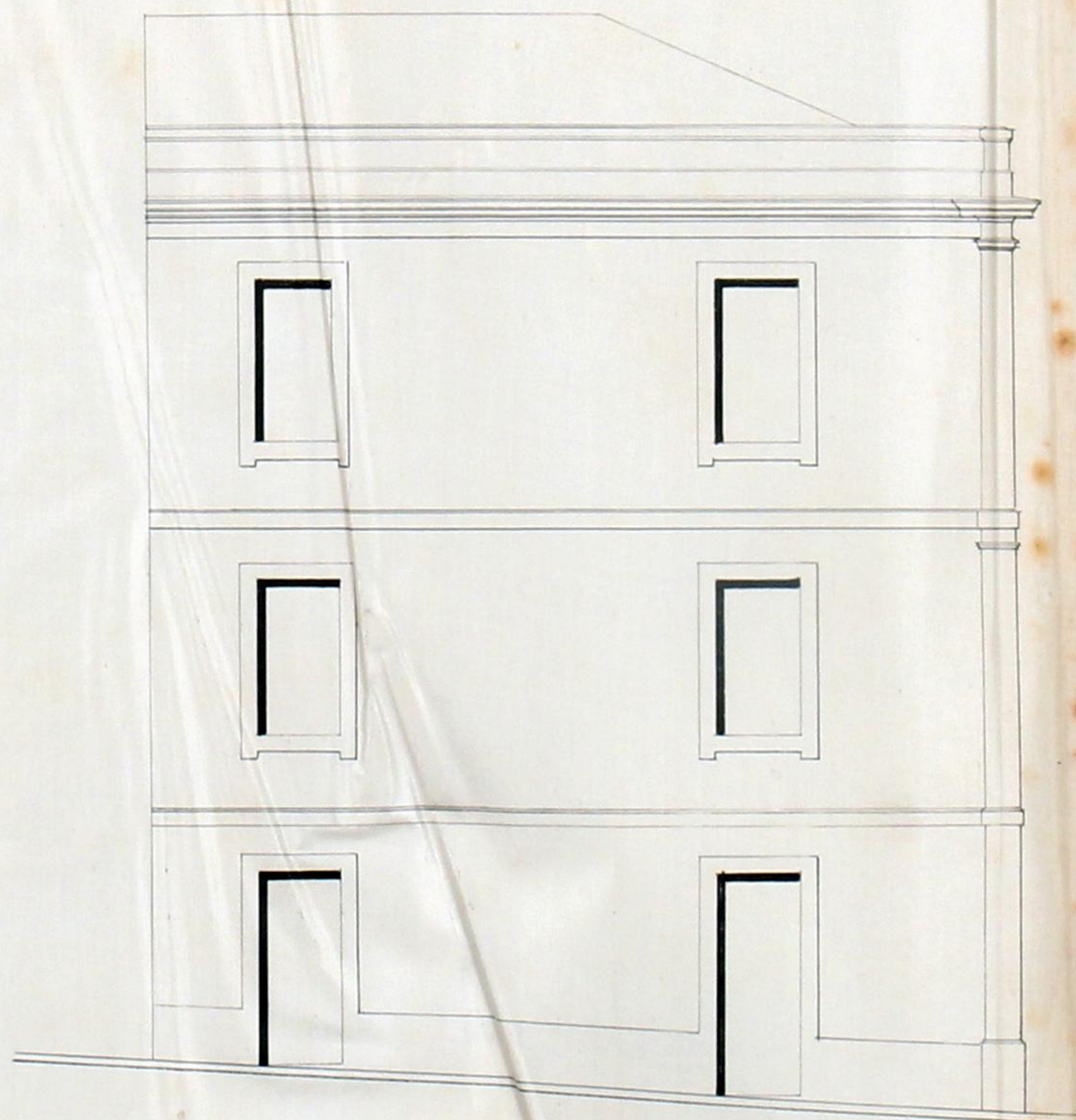
Fachada para a travessa 24 d'Agosto