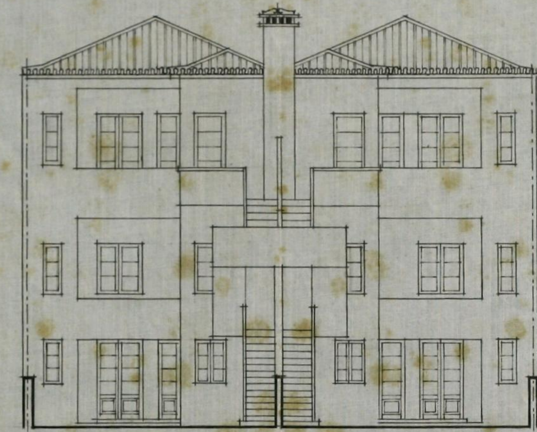
FACHADA POSTERIOR • EGC. 0,01 D.M.

CAMARA MUNICIPAL DO PORTO 2ª Repartição - Edificações Urbanas APROVADO por despacho de 25 MAR. 1950 O CHEFE DA REPARTIÇÃO