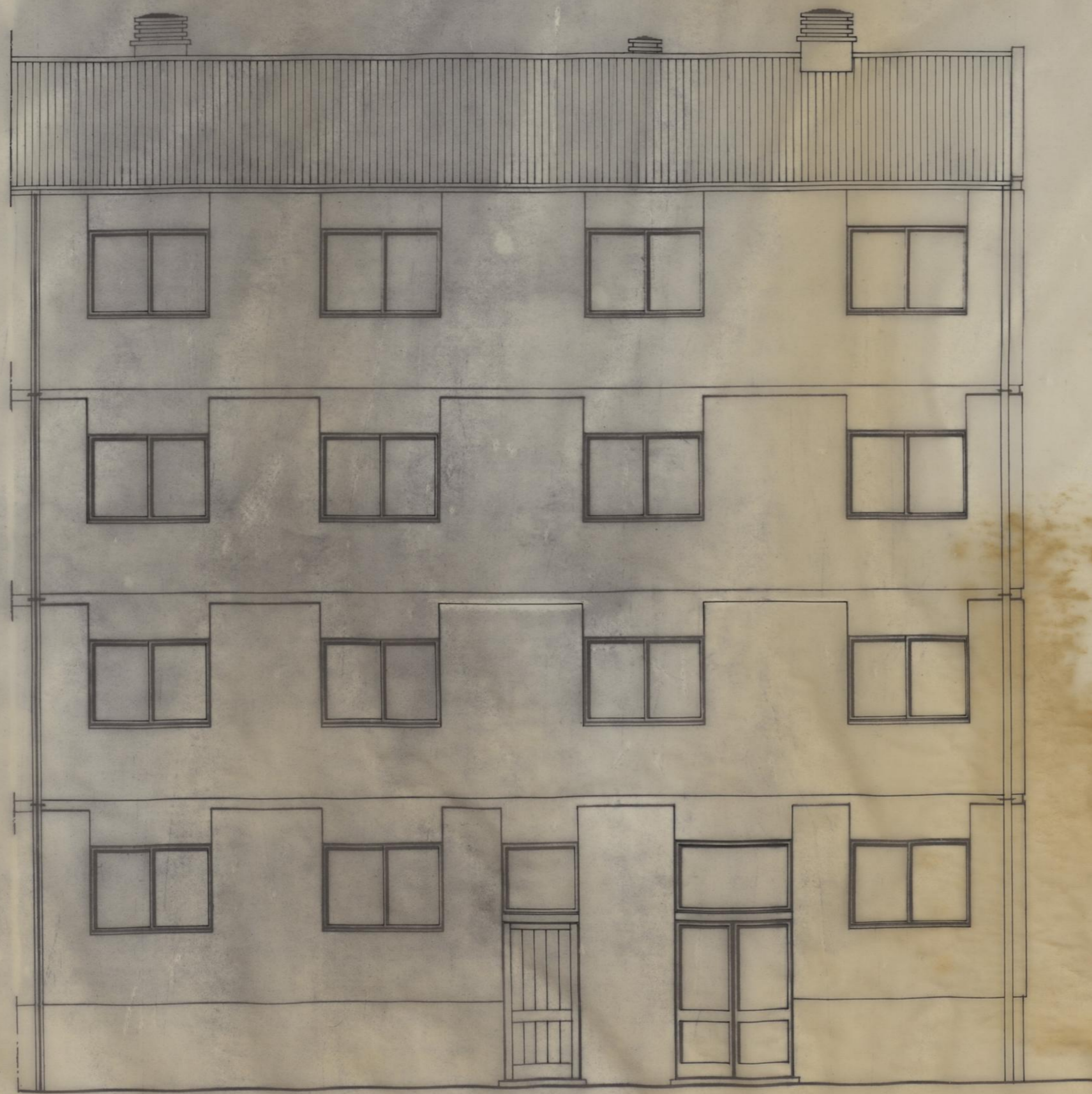
ALÇADOS TIPO (ANTERIOR) T3 / T3